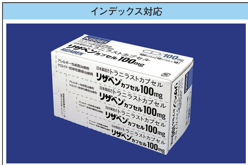
※バラ包装カートンについては、天面内側のフラップ部にインデックス対応をいたします。

また、インデックス等にご利用いただけるようにカートンへ複数サイズの製品名を表示いたします(ミシン目はありません)。