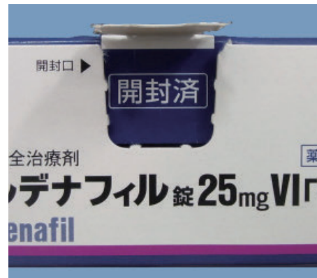
再封されている場合 （「開封済」が表示されている）