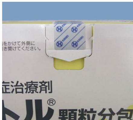
ミシン目が切れている場合