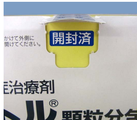
再封されている場合 （「開封済」が表示されている）