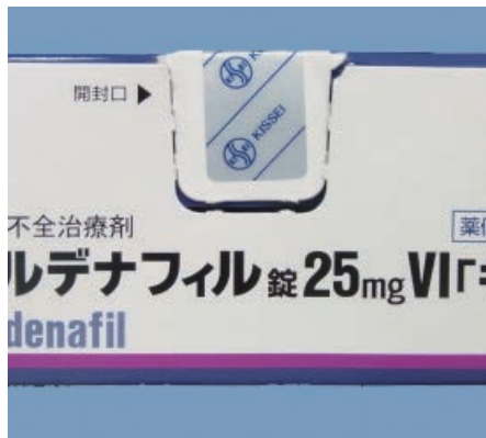
ミシン目が切れている場合