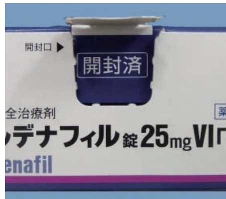
再封されている場合 （「開封済」が表示されている）